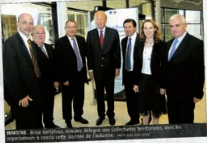
MINISTRE. Brice Hortefeux, ministre délégué aux Collectivités territoriales, avec les organisateurs a tancé cette Journée de l'Industrie.

COLLOQUE ■ Avec plus de 100.000 emplois salariés, l'activité industrielle structure l'économie régionale... L'Auvergne est à la septième place du classement des régions françaises les plus industrielles. Cela méritait une Journée de l'Industrie pour faire connaître les richesses de ce secteur et évoquer sa nécessaire mutation pour faire face aux enjeux à venir.