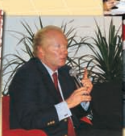
Brice Hortefeux Ministre délégué aux collectivités territoriales