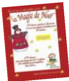
recto - ticket à gratter