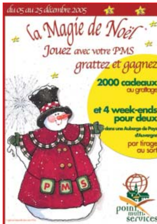
Spécimen - Affiche de l'action