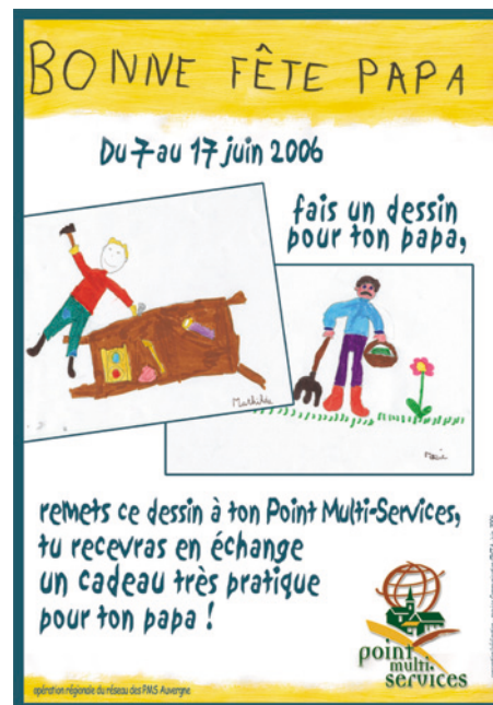
Spécimen - Affiche de l'action

Afin de capitaliser et d'échanger sur les expériences, nous recenserons ensuite les initiatives prises par chacun d'entre vous. Pensez également à faire des photos de votre commerce aux couleurs de l'action "Bonne fête papa" !